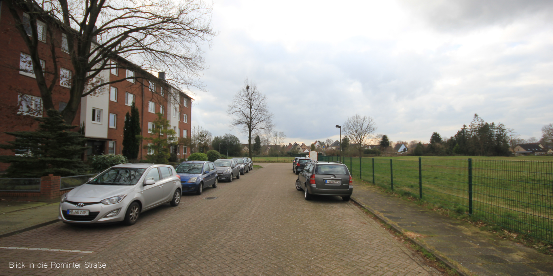
Blick in die Rominter Straße