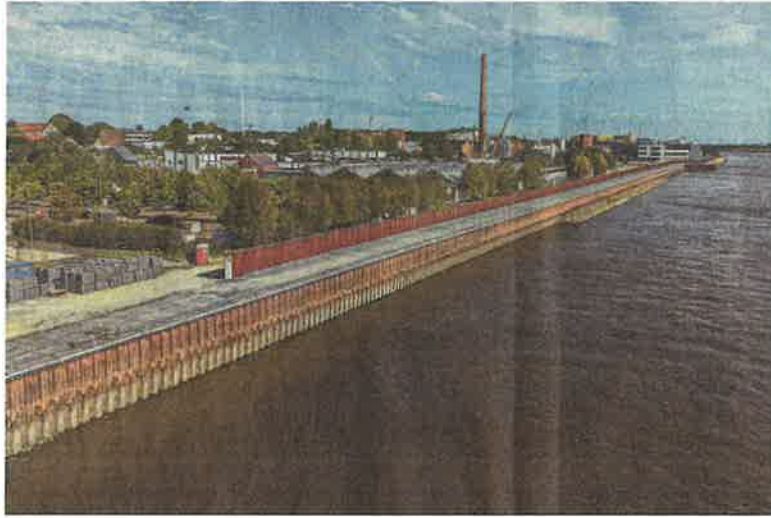
Der neue Uferweg im Bau.